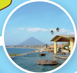
道の駅 山川港 活お海道

かいもんだけ 開聞岳 発電所から車で約20分 標高924メートル。整った山頂となだらかな稜線が美しく、秀麗「薩摩富士」の異名をとり、「日本百名山」にも数えられています。